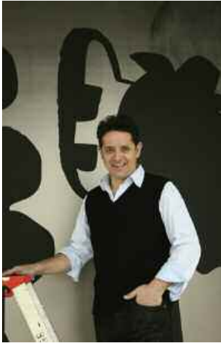
1. Jean de Loisy. « La sculpture idéale est une route » (Carl André). D.R.