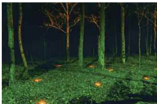
14. Véronique Joumard, Le circuit des lumières , 1996. Partenaires : Fondation de France, Initiative Européenne Leader II, commune de Grancey-le-Château et SISECO, mécénat iGuzzini.