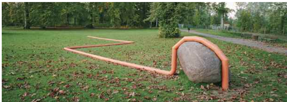
13. Détour , 2005, parc de sculpture de Pourtales.