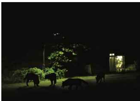
7. La Meute , 2008. Photo : Stéphane Thidet.