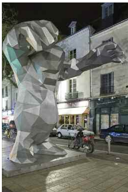
15. Xavier Veilhan, Le Monstre , 2004. Installation Place du Grand Marché, Tours.