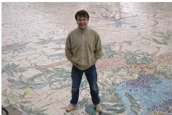
12. L'artère , 2003/2005, Parc de La Villette.