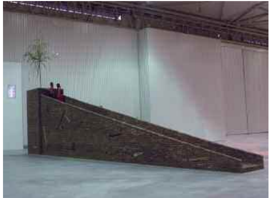
4. There is here, here is there , Chengdu Biennale, 2005.