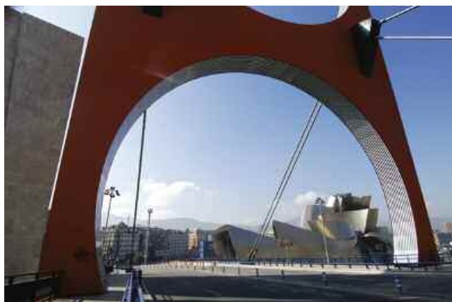
9. Photo-souvenir : Arcos rojos, travail in situ , Puente de la Salve, Bilbao, 2007. Détail.