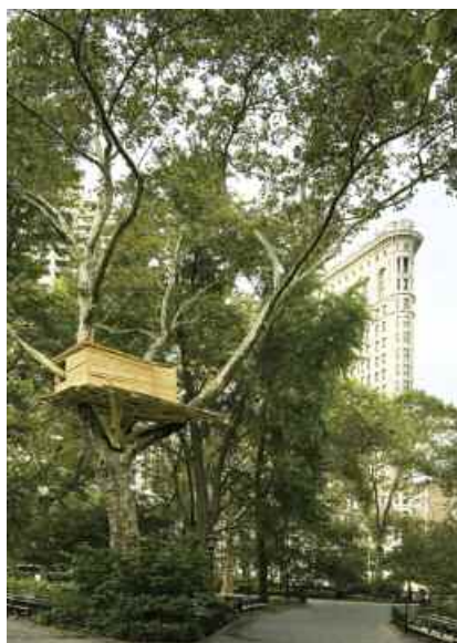
6. Tree Huts , 2008. Installation in situ, dimensions variables, bois. Vue de l'exposition Tree Huts , Madison Square garden, New-York. © The artist. Photo : Ellen Page Wilson. Courtesy the artist and Kamel Mennour, Paris.