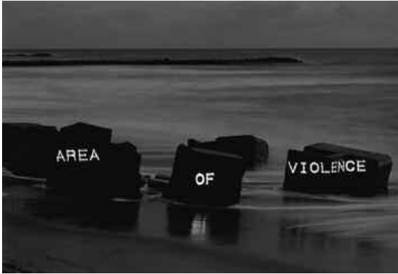
17. Atlantic Wall , 1995.