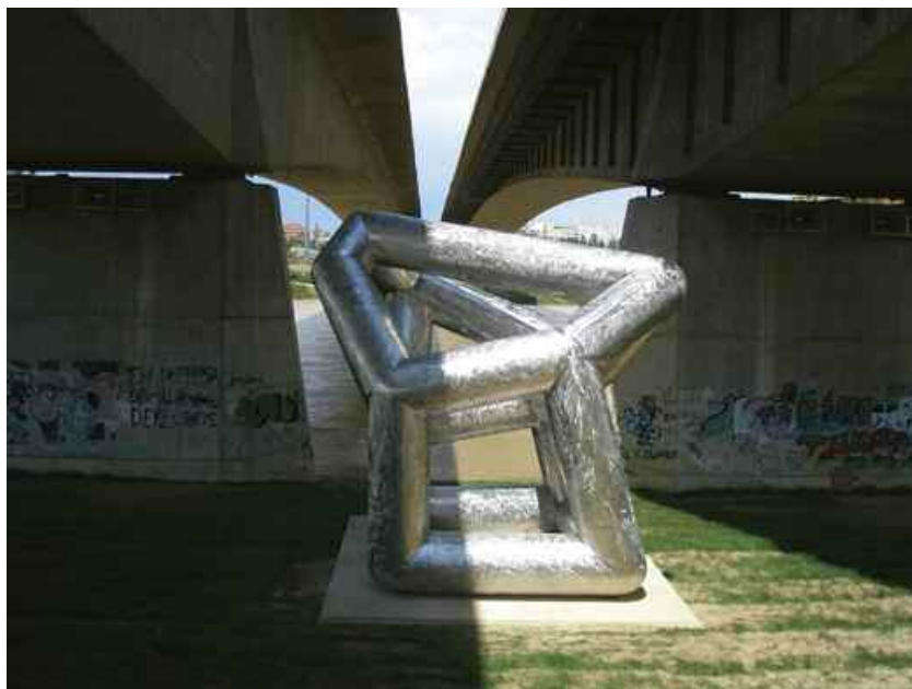
16. Water Under The Bridge , 2008, Zaragossa, Spain. D.R.