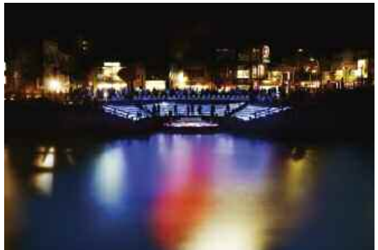
5. Luminous BandGap , 2009.