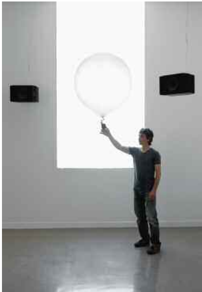
2. Scanner , prototype, technique mixte, dimensions au sol 8 x 8 m., 2006. Ballon en latex gonflé à l'hélium, microphone sans fil, système de traitement et de diffusion audio multicanal, ventilateur. Collection du Fnac (Fonds National d'art contemporain), France.