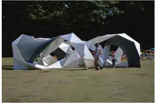
3. Ueno Park, Chyac Park Project.