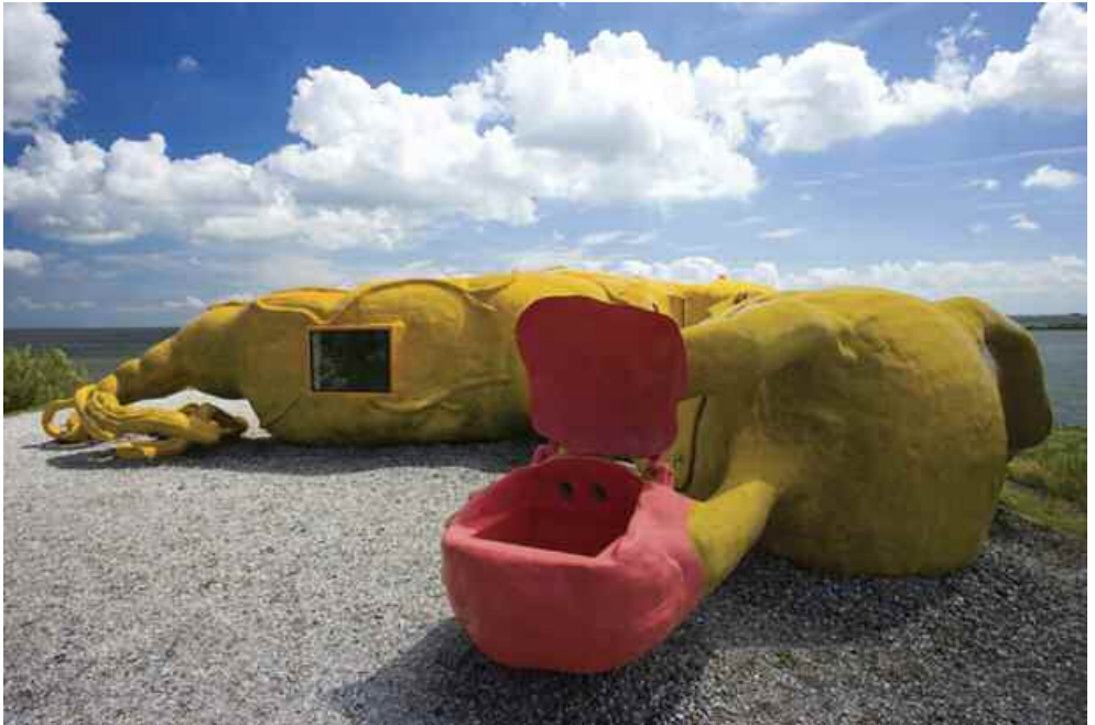
19. Huize Organus , 2008.